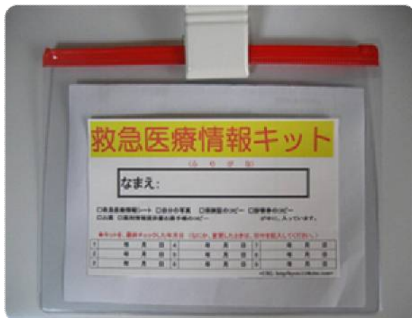
冷蔵庫のドアにマグネットではさんで使います